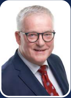
Franz Wurzer Bürgermeister